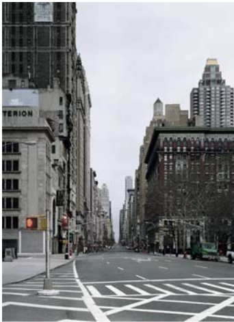
Fotografie von Ralf Kaspers: Du sollst den Sabbat heilig halten

Ich bin JHWH, dein Gott, der dich aus Ägypten geführt hat, aus dem Sklavenhaus. (Ex 20,2)